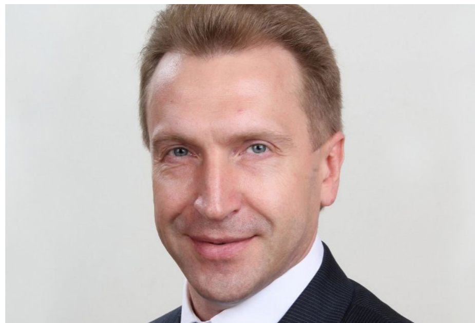
И. И. ШУВАЛОВ

Первый заместитель Председателя Правительства РФ