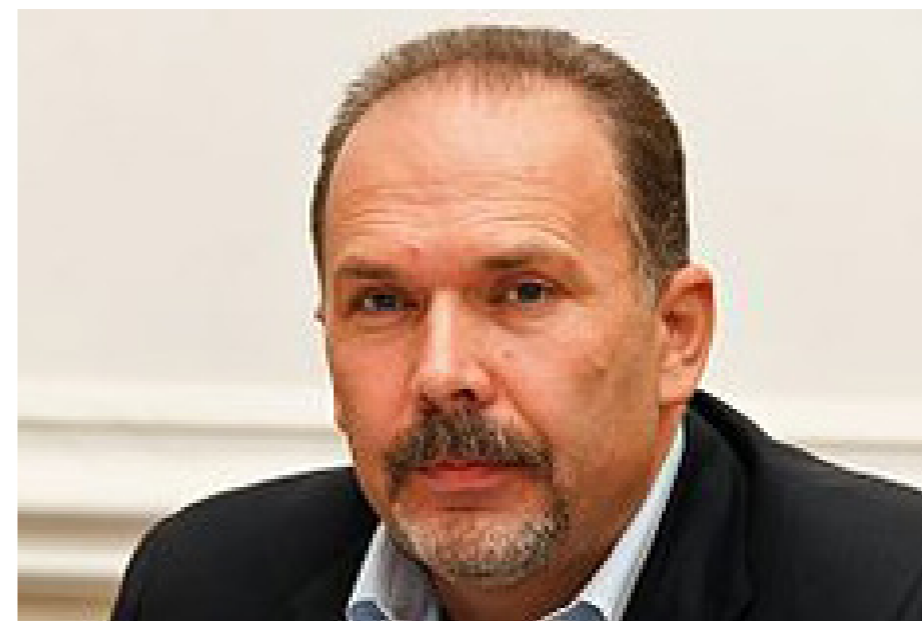
М. А. МЕНЬ

Первый заместитель Председателя Правительства РФ